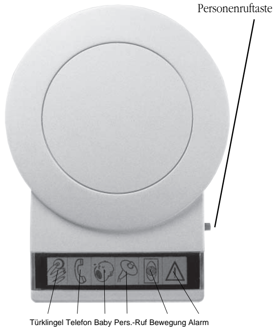
Türklingel Telefon Baby Pers.-Ruf Bewegung Alarm