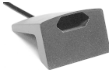
Aufstellfuß für Funkblitzlampe

Anschluss: Anschluss an 230 V~ durch Einstecken in eine Netzsteckdose.